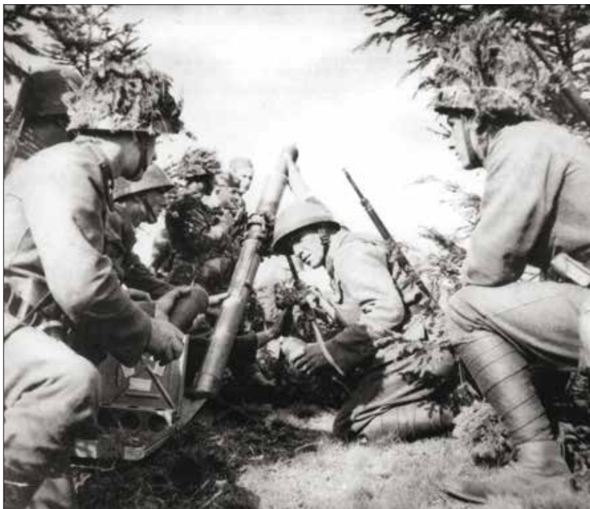
Obrázok 4: Povstaleckí vojaci pri Telgárte