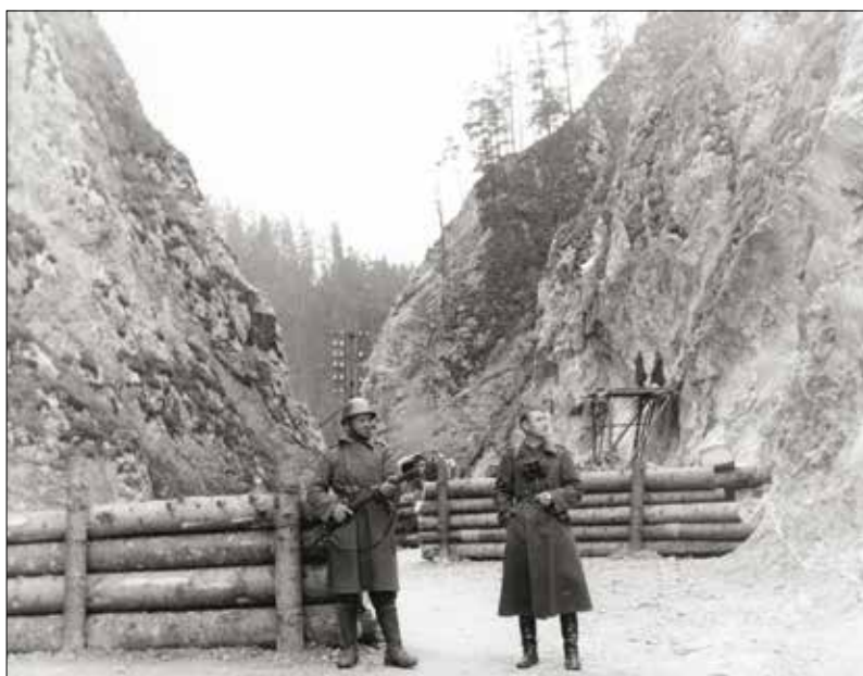
Obrázok 3: Obrana Vernáru