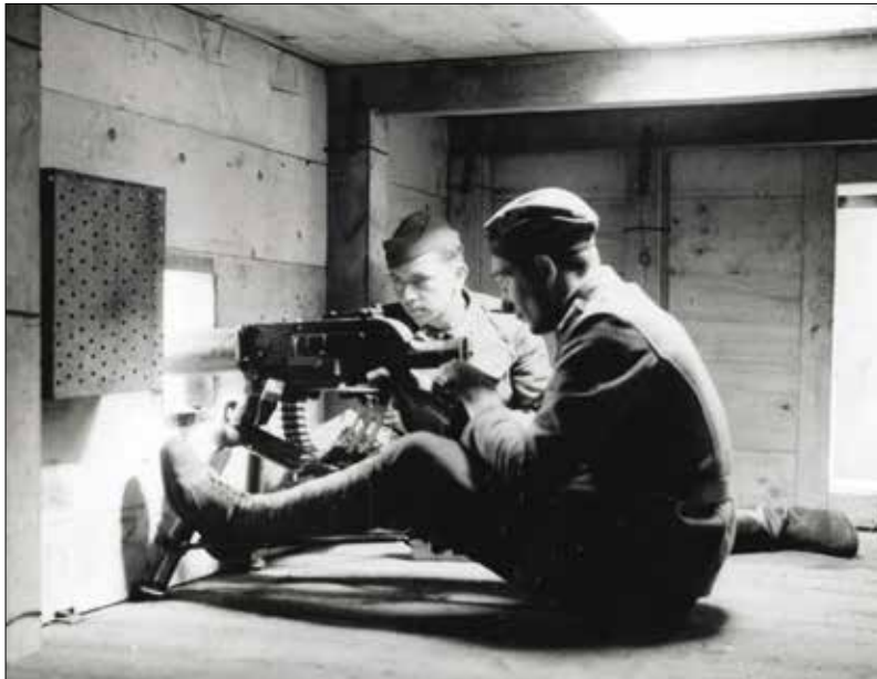
Obrázok 6: Guľometný vozeň improvizovaného pancierového vlaku Štefánik

V priebehu Slovenského národného povstania začali bojujúce jednotky 1. čs. armády pociťovať nedostatok ťažkých zbraní. Ako náhrada za bojovú techniku boli v dielňach Slovenských železníc vo Zvolene narýchlo, za takmer nepretržitej prevádzky, postavené tri improvizované pancierové vlaky. Pri ich výrobe boli použité vyradené tanky Lt. vz. 35. Do výbavy vlaku taktiež pribudli delá a ťažké guľomety. Každý z vagónov bol obložený kotlovými plátmi vyrobenými vo Švermových železiarňach v Podbrezovej. Cieľom pancierových vlakov bola priama podpora postupujúcej pechoty v strategických bodoch obrany územia.