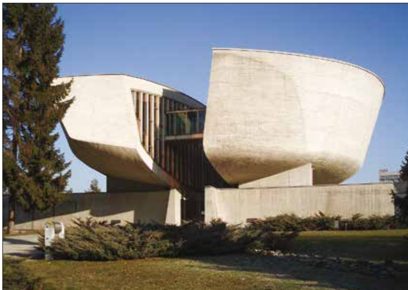
Obrázok 7: Múzeum SNP v Banskej Bystrici

Expozícia Múzea SNP z roku 1984 už nedokladovala a nedokumentovala najnovšie poznatky historickej vedy a nespĺňala ani požiadavky väčšiny návštevníkov múzea. Z uvedeného dôvodu múzeum zrealizovalo v roku 1992 rozsiahlejšie zmeny. Vlastnými silami a v histórii múzea s najnižšími finančnými nákladmi pripravilo novú stálu expozíciu múzea s názvom Slováci na bojiskách 1. a 2. svetovej vojny. Toto obdobie je charakteristické hľadaním nových smerov rozvoja zbierkotvornej, vedecko-výskumnej, prezentačnej a vzdelávacej činnosti múzea.