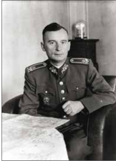
Obrázok 1: pplk. Ján Golian

Prípravy povstania sa však oneskorovali, a to nielen vo vojenských jednotkách na západnom Slovensku, ale aj v jednotkách Poľnej armády, ktoré sa nachádzali v priestore Duklianskeho a Lupkovského priesmyku. Vzhľadom k vývoju na východnom a talianskom fronte sa Ján Ursíny, zástupca občiansko-demokratického odboja, rozhodol hľadať potencionálnych odbojových partnerov na prípravu likvidácie ľudáckeho režimu a obnovenia Československého štátu. Veľké možnosti ponúkala spolupráca s komunistami, ako značne aktívnou zložkou odboja politicky naviazanou na Sovietsky zväz, ktorý veľmocensky vstupoval do stredoeurópskeho priestoru. Vyústením ilegálnych rokovaní viacerých strán domáceho odboja bolo podpísanie Vianočnej dohody v Bratislave. Išlo o programovú platformu zjednotenia komunistického a občiansko-demokratického odboja. Krátko po podpísaní Vianočnej dohody sa jej signatári pustili do príprav ich hlavného cieľa – celonárodného protifašistického povstania.